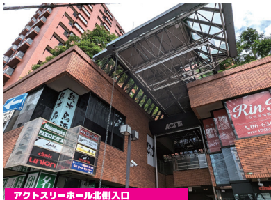
アクトスリーホール北側入口